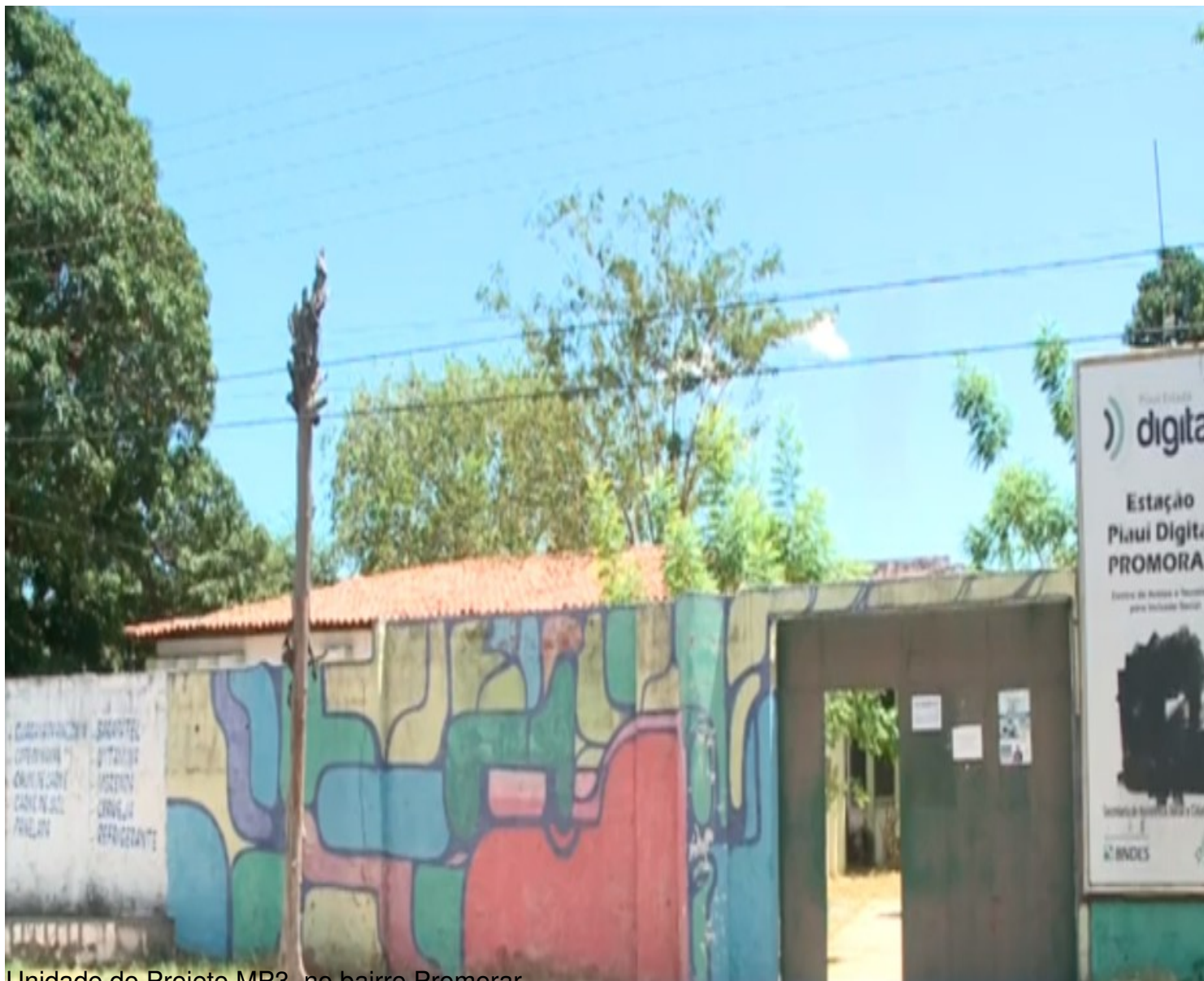
Unidade do Projeto MP3, no bairro Promorar