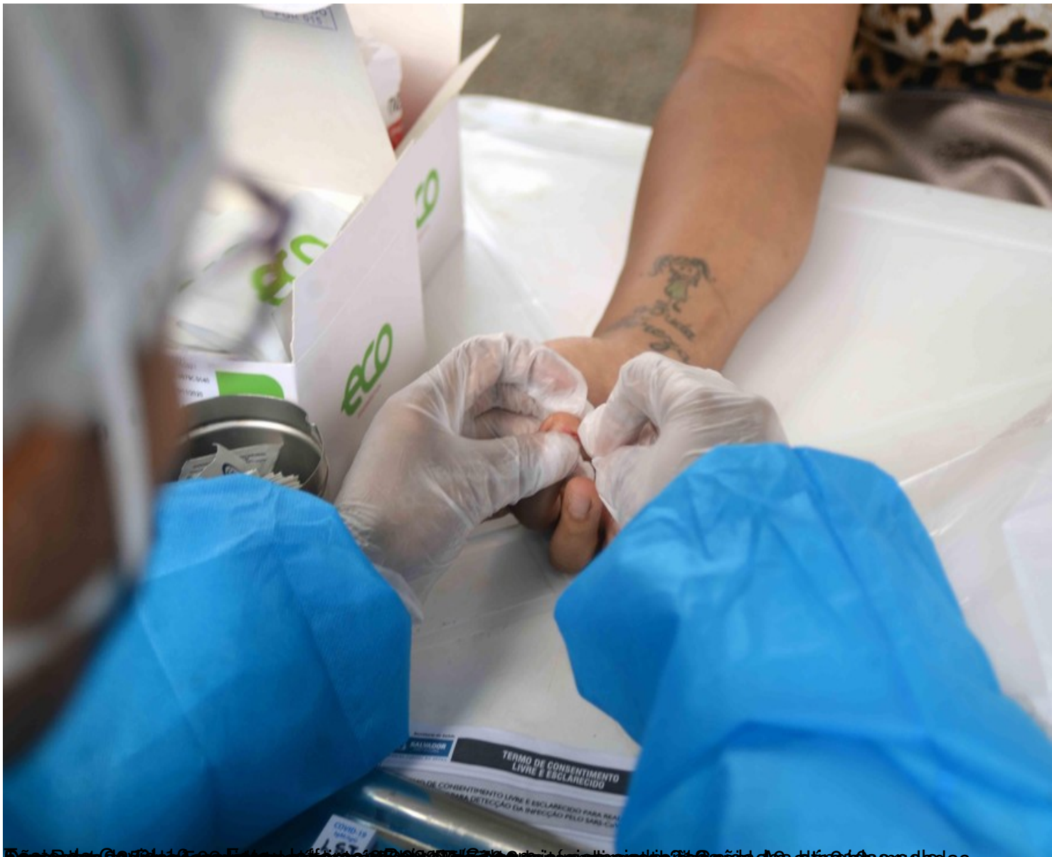
5 de julho de 2020, 19h30. Um profissional de saúde coleta uma amostra de sangue de um paciente em uma clínica de saúde em Teresopolis, no Rio de Janeiro.