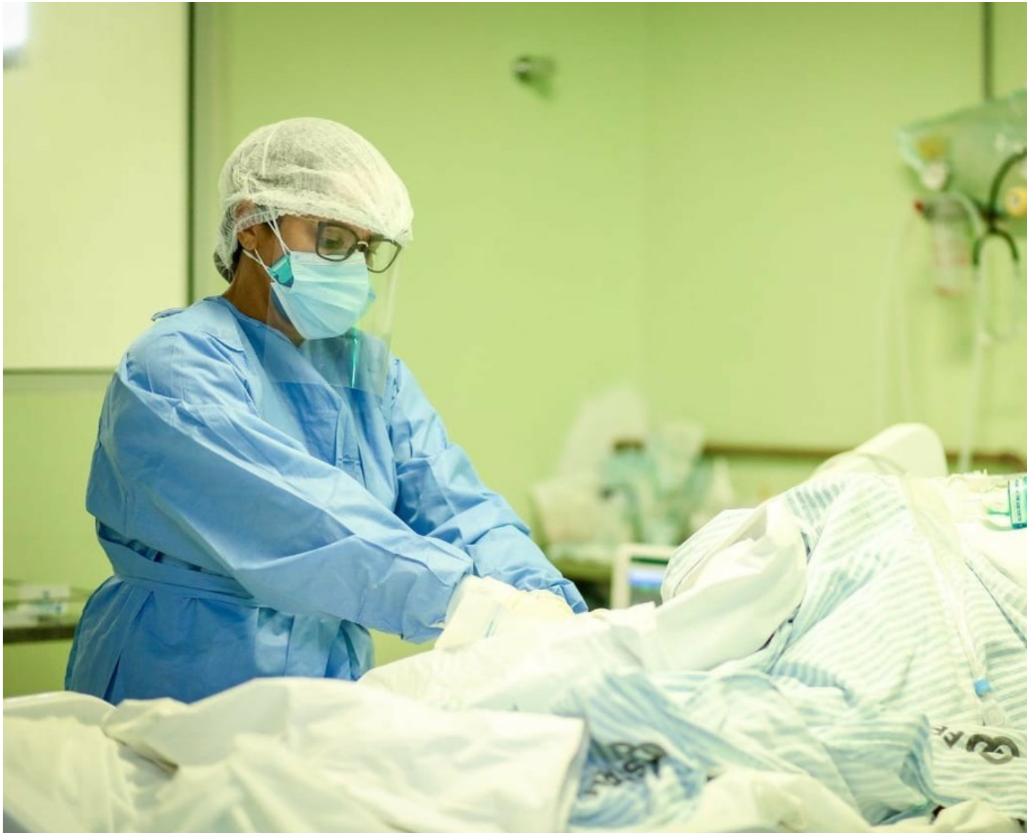
Paciente em leito de UTI Covid no Piauí

Segundo o boletim, dos 981 casos confirmados da doença, 545 são mulheres e 436 homens, com idades que variam de nove meses a 99 anos.